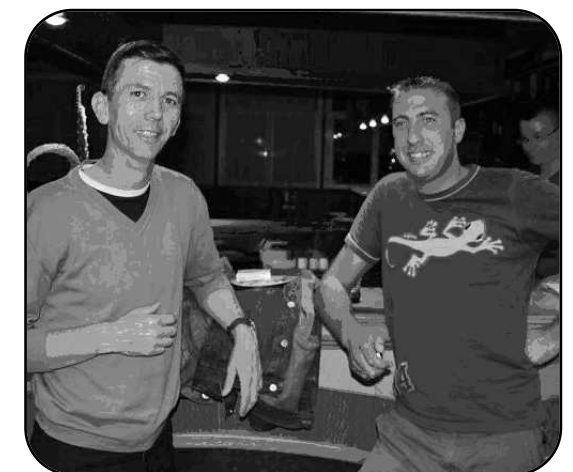
Equipe classée 4ème

En fin d'année ou tout début janvier nous comptons organiser une soirée karaoké, alors le ridicule ne tuant pas, venez nombreux et nombreuses !