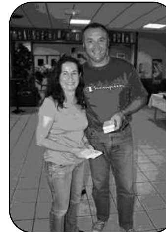
Equipe classée 2ème

Après un pot symbolique en juin dernier pour lancer la création de l'Amicale nous avons organisé un tournoi de belote et un buffet campagnard le 16 septembre dernier, tournoi richement doté de prix grâce à la France Mutualiste et au GMPA.